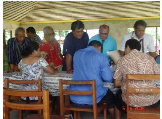
Faatalatalanoaga ma Sui o le Malo i Savaii