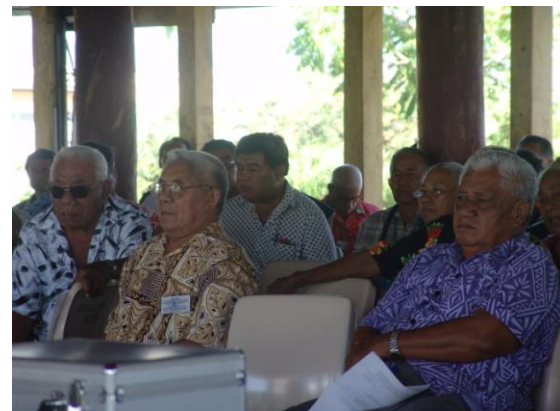
Faatalatalanoaga ma Pulenuu i Upolu