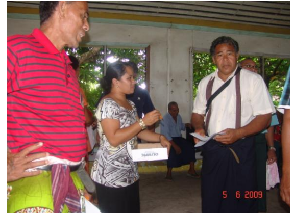
Tufatufaina o Pepa o Fesili i le Faatalatalanoaga ma Sui o le Malo i Savaii